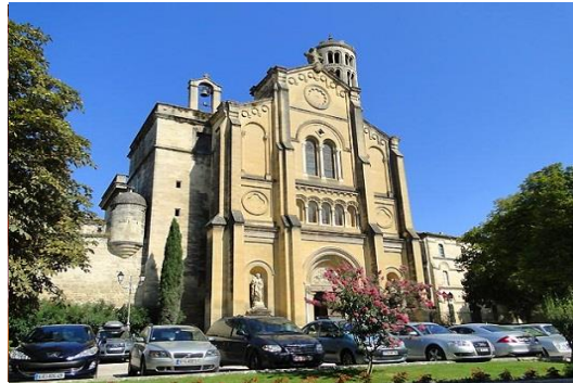
Uzès & le Protestantisme