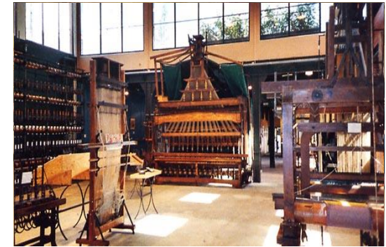
Le Musée de la soie