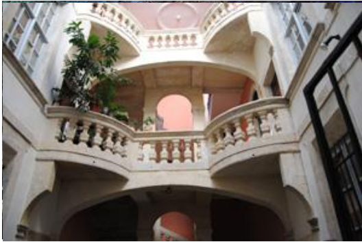
Visite guidée Nîmes