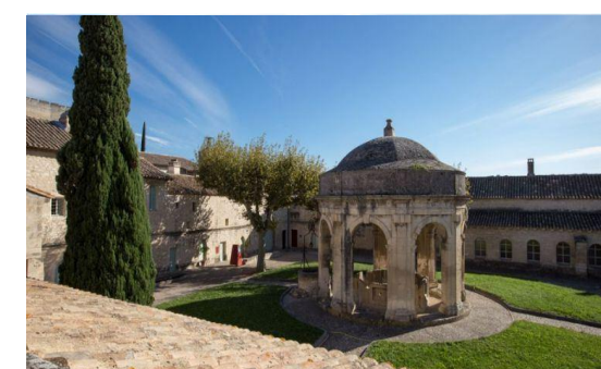
Chartreuse du val de bénédiction