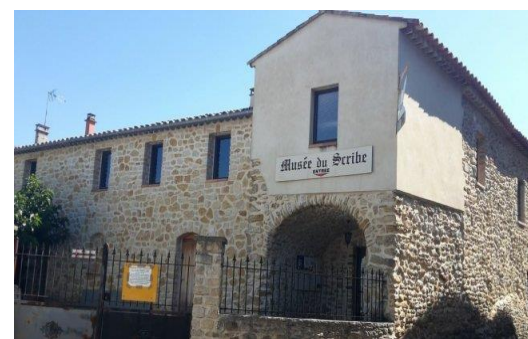
Le Musée du Scribe