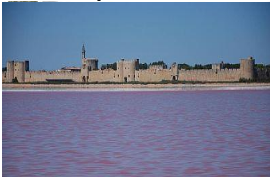
Visite guidée Aigues-Mortes