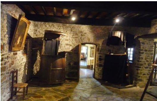
Le musée du Désert