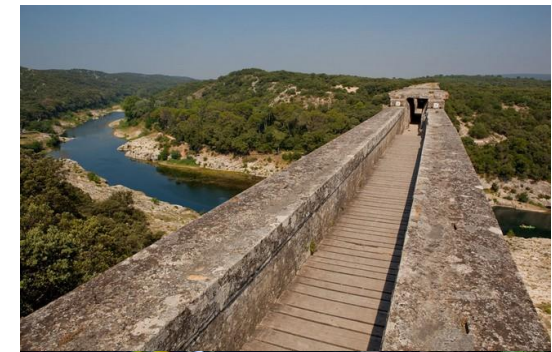
Visite guidée Pont Du Gard